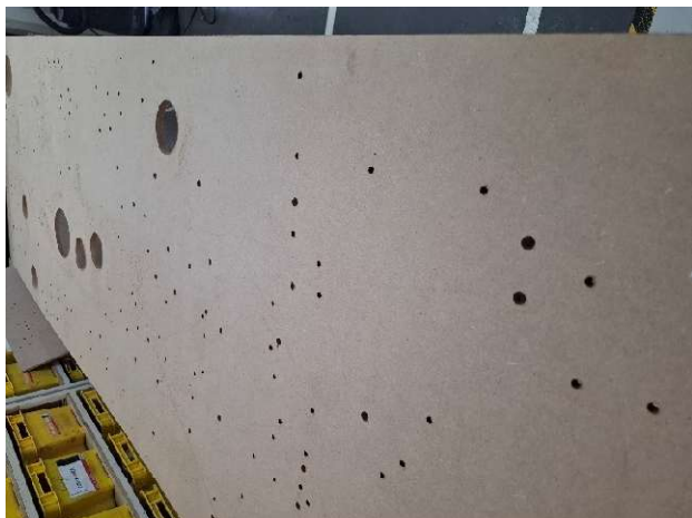
1 - Chapa em MDF