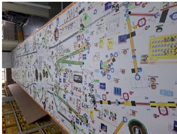
2 - Lona de impressão