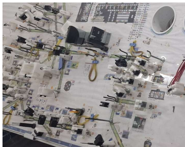
6 - Painel finalizado