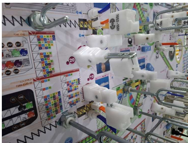
4 - Elementos mistos